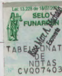
TABELA DE NOTAS FISCAIS CVQ07403 Rua Rio Grande do Sul, 140 - Barbosa Ferraz, PR CEP 85960-000 Fone (44) 3275-1698